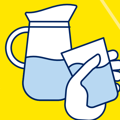
BUVEZ DE L'EAU