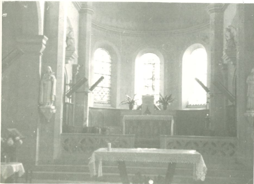
Le Chœur et l'Autel